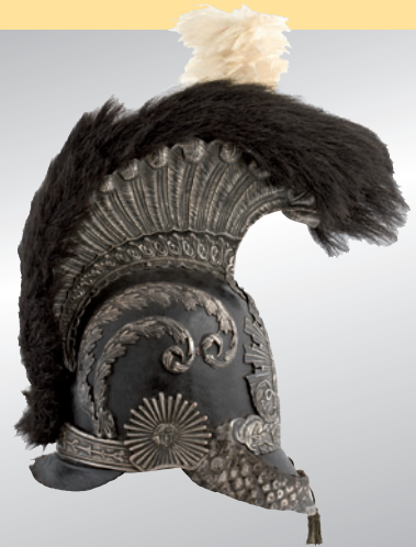
Helm der Gardes du Corps du Roi, Frankreich, 1. Modell 1814-1820 A helmet for the Gardes du Corps du Roi, France, 1st model, 1814-1820 € 7.500