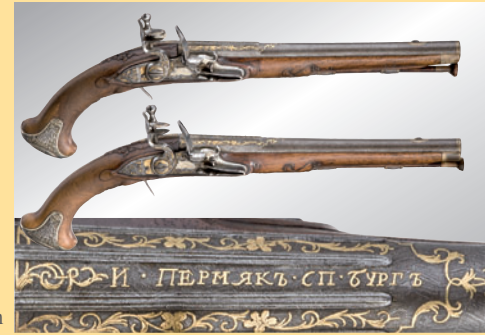
Ein paar bedeutende Steinschlosspistolen, Ivan Permiak in St Petersburg um 1770 A pair of significant flintlock pistols by Ivan Permiak in St. Petersburg, circa 1770 € 75.000