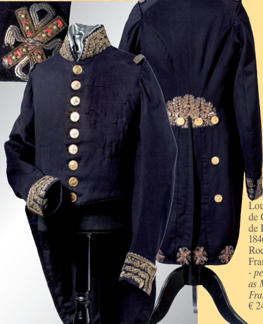
Louis Auguste Victor de Ghaisne, Comte de Bourmont (1773- 1846) - persönlicher Rock als Maréchal de France ab 1830 - personal frockcoat as Maréchal de France after 1830 € 24.000