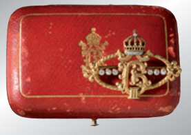
Zar Boris III. von Bulgarien, diamantbesetzte Geschenkbrosche, A present brooch with diamonds € 2.600