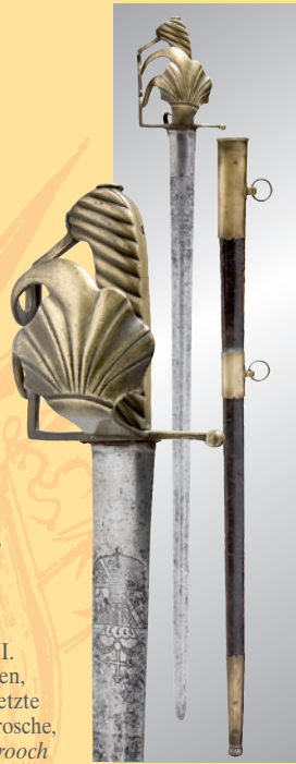
Pallasch der schweren Würzburger Kavallerie (1779-1795) A broadsword of the heavy Würzburg Cavalry, (1779-1795) € 3.500