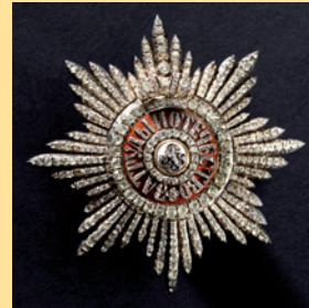
St. Alexander Nevsky-Orden, Bruststern 1. Klasse mit Brillanten Order of St. Alexander Nevsky, 1st Class Breast Star with Diamonds € 65.000